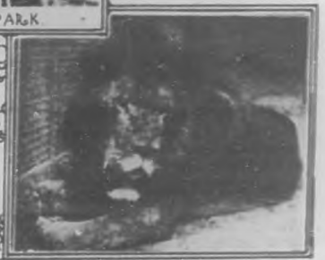
LEO. I. - FAMOSO LEON