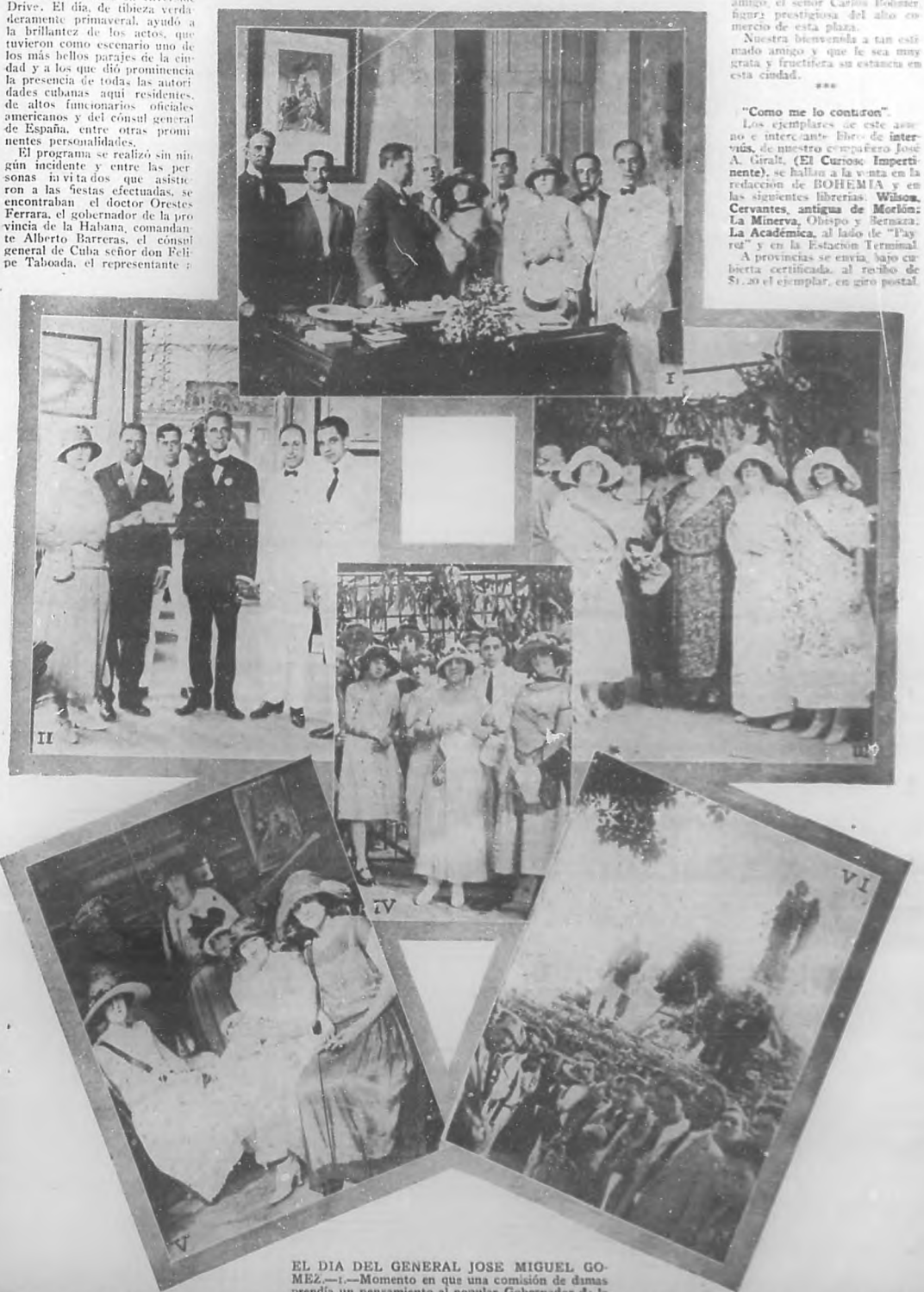
EL DIA DEL GENERAL JOSE MIGUEL GOMEZ.—1.—Momento en que una comisión de damas prendía un pensamiento al popular Gobernador de la

Los ejemplares de este semanario de interesante contenido, de nuestro compañero José A. Giralt, (El Curioso, Impertinente), se hallan a la venta en la redacción de BOHEMIA y en las siguientes librerías: Wilson, Cervantes, antigua de Morlón; La Minerva, Obispo y Bernaza; La Académica, al lado de "Payret" y en la Estación Terminal. A provincias se envía, bajo cubierta certificada, al costo de $1.20 el ejemplar, en giro postal.