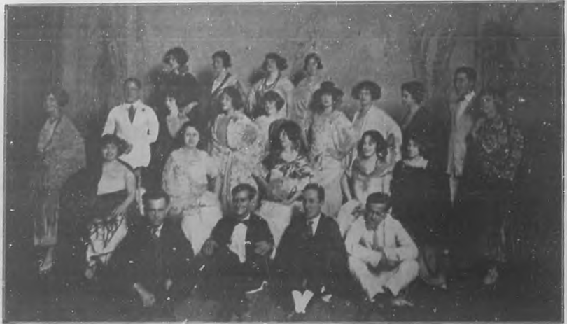
Un grupo de alumnas de la Academia de Canto "Amelia Izquierdo", que tomaron parte en la fiesta de arte que tuvo un brillante éxito la noche del 11 en el teatro "Nacional".

En la última semana de junio serán publicadas los nombres de las personas que integran el Jurado, los de las que se comencen a exhibir—con expresión de los días que corresponden a cada casa— el lugar donde se celebrará la selección de labores y los premios