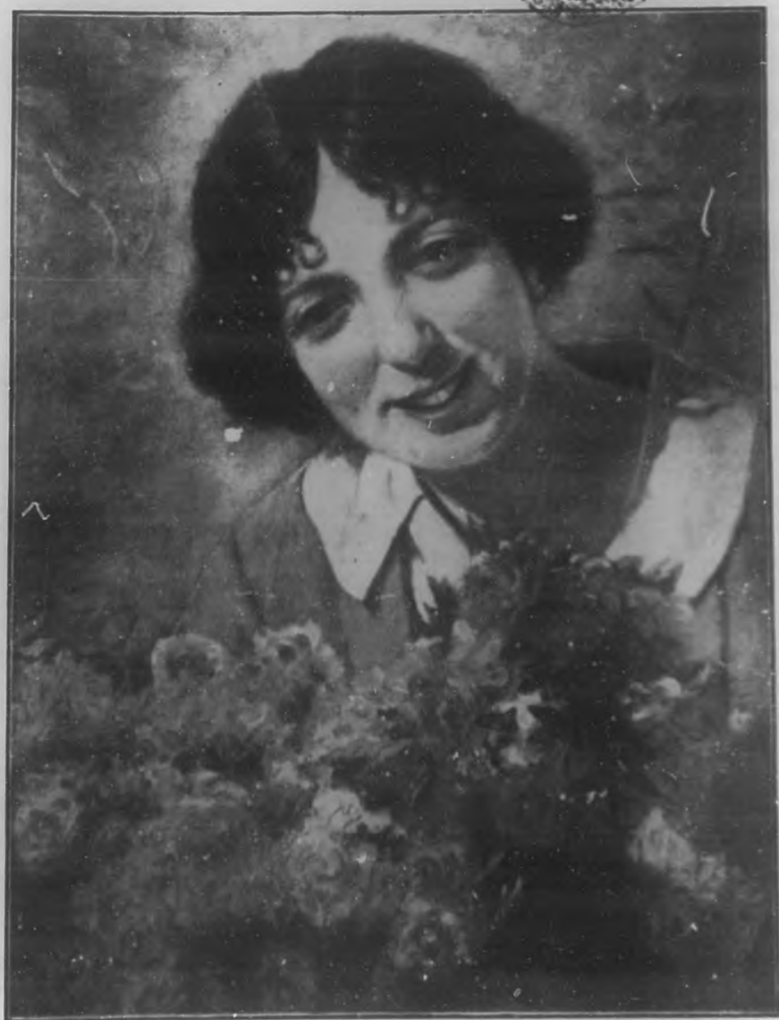
LA SONRISA DE UNA FLOR