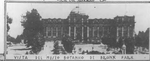
VISTA DEL MUSEO BOTANICO DE BRONX PARK